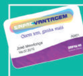
Descontos em produtos, serviços e atividades culturais