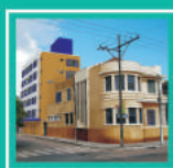
Casa do Professor e Fundação Ecarta